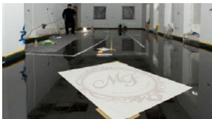
Die Logos werden unter der Deckschicht fixiert