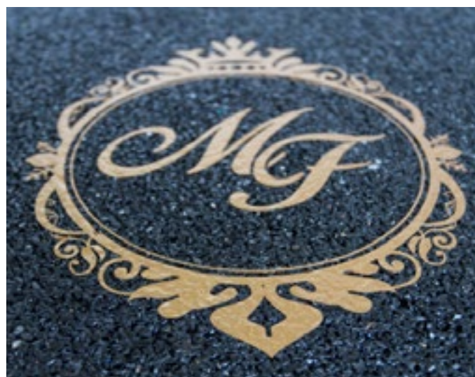
Steinteppich im Außenbereich

VIASOL PU-T711 wird als UV- und farbtone stabiles, transparentes, emissionsarmes und glänzendes Bindemittel für VIASOL Steinteppiche im Innen- und Außenbereich auf Polyurethanharzbasis eingesetzt.